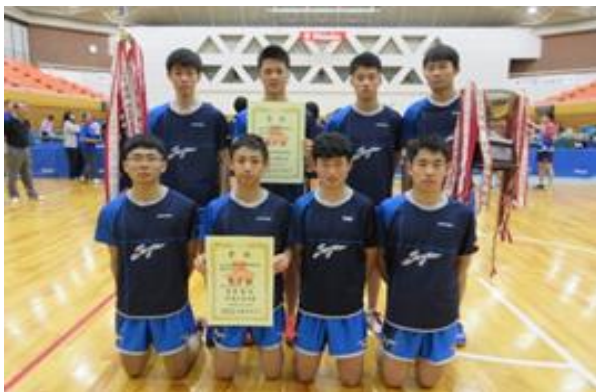
男子学校対抗優勝 東海大菅生 (東京)