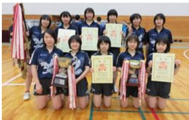
女子学校対抗優勝 横浜隼人 (神奈川)