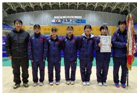
女子学校対抗優勝 青森商業高校